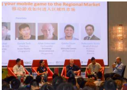
主会场 互动演讲 >>>